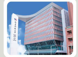
▲ 南臺科技大學大門照